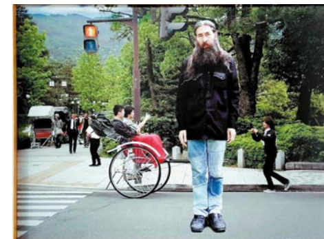
Andrzej Dudek-Dürer, Meta fotografia... Kioto, żywa rzeźba , 2004, fotografia, solwentografia na płótnie, 75 x 100 cm

punktem wyjścia jest medytacja i stan metafizyczny nastawiony na duchowość i doskonałenie.