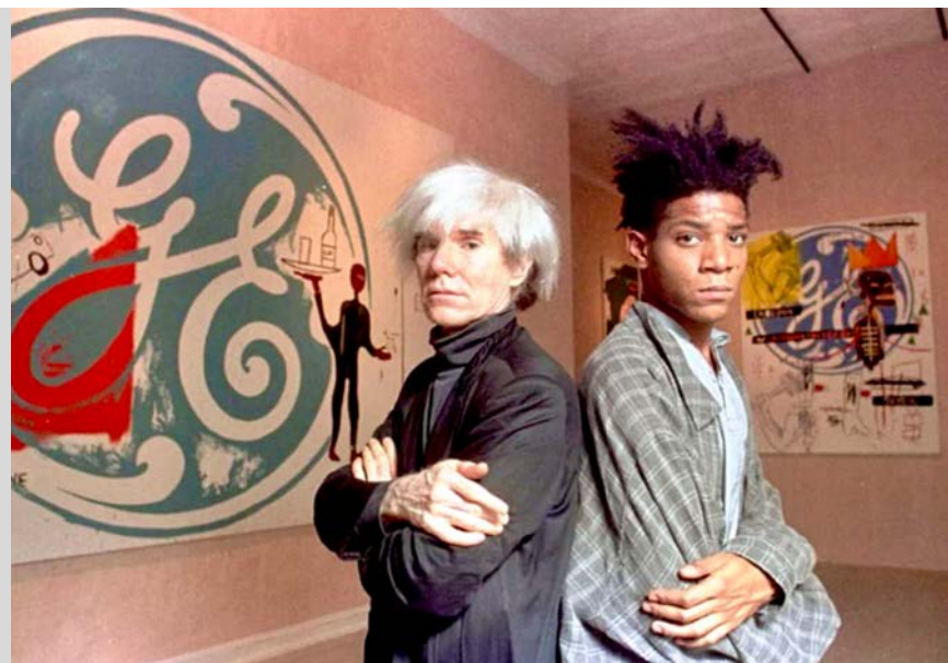
Warhol & Basquiat

Współkreacja artystów ma niezwykłą moc i potencjał do wytworzenia czegoś wyjątkowego. Takim przykładem jest współpraca między