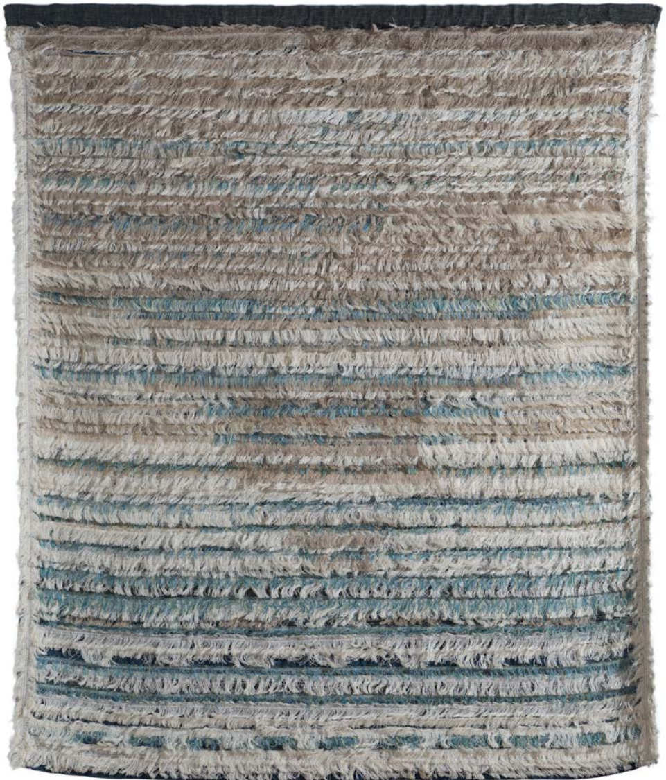
Ewa Poradowska-Werszler, Szron , 2004 r., 180 × 150 cm.