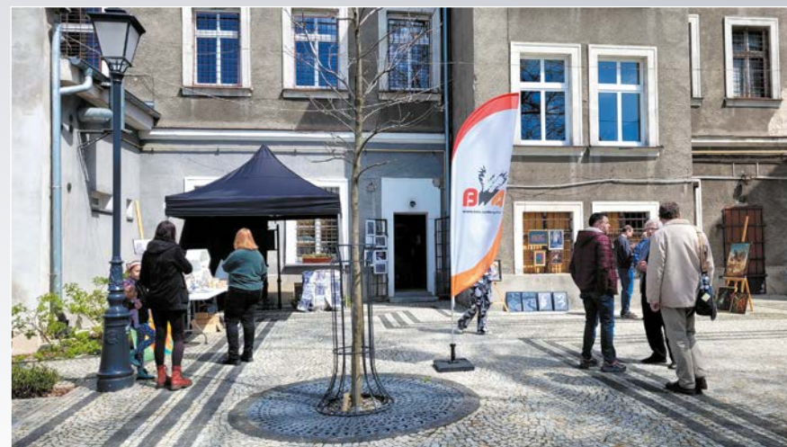
I Targi Sztuki