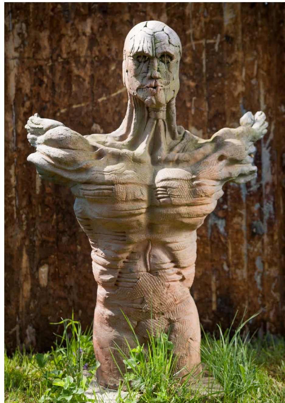
Stanisław Wiącek, Odlot , 1996 r., ceramika szkliona, 1250 °C, wys. 75 cm.