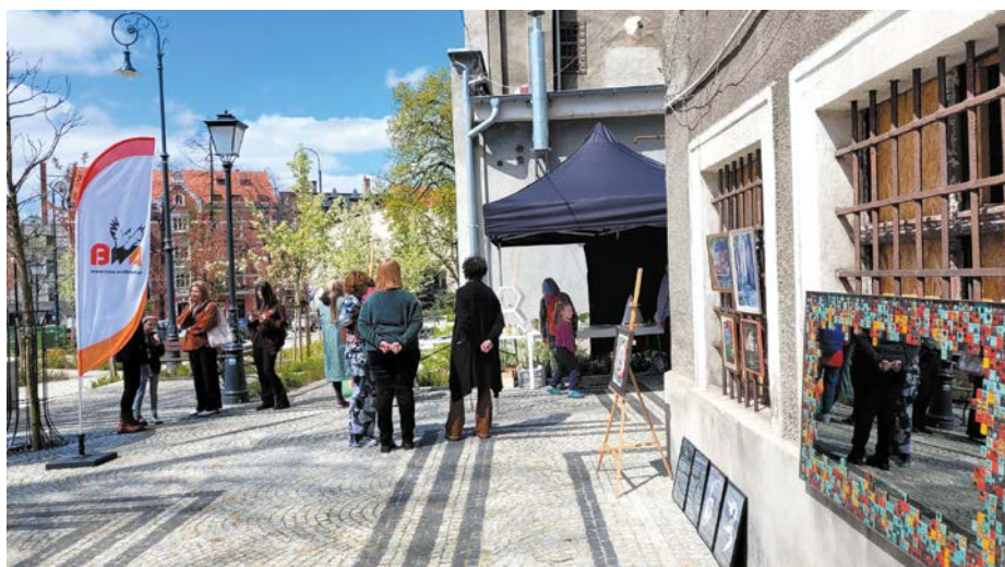
I Targi Sztuki